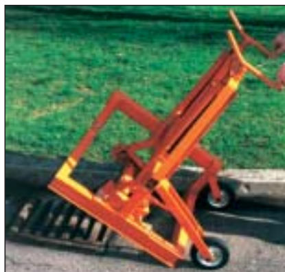
Rahmenheber für Straenabläufe

Durch entsprechendes Spezialwerkzeug können auch ziehbare Straenabläufe mit dem gleichen Verfahren reguliert werden.