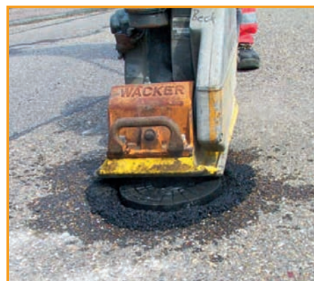
7. Einsetzen der einwalzbaren Beck-Straßenkappe