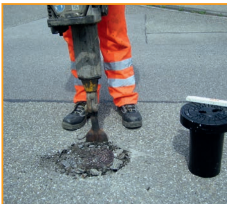
2. Nur geringer Aufbruch des Fahrbahnbelags