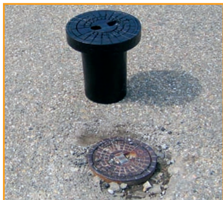
1. Erfassen des Schadensbildes