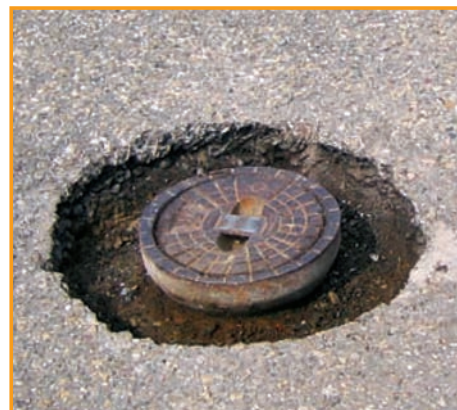
3. Abtrennen des alten Gussoberteils der vorhandenen Straßenkappe