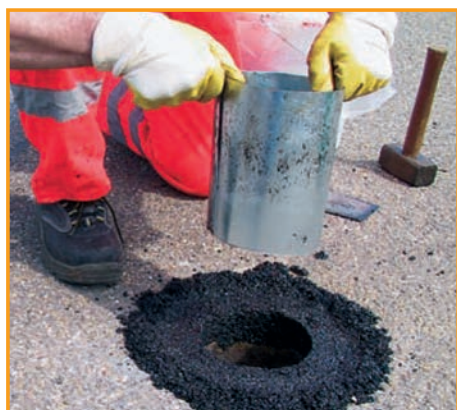
5. Aufbruch mit reaktivem Asphalt verfüllen und vorverdichten