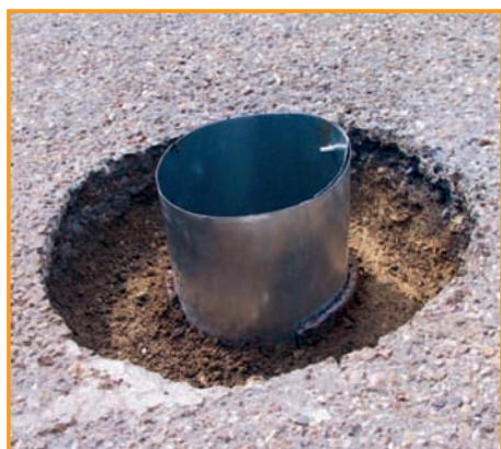
4. Reinigen des Aufbruchs und Einsetzen der Bitumenschalung, anbringen von Haftgrund und Nahtkleber